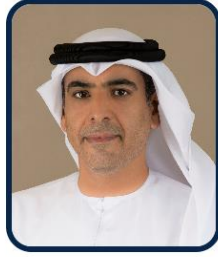
سعادة الدكتور محمد راشد الهاملي