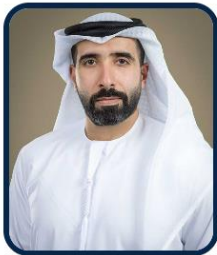
سعادة غانم سلطان السويدي