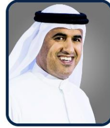
سعادة مبارك حمد المهيري