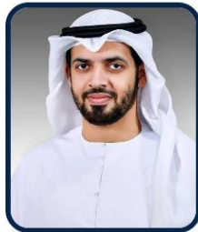
سعادة الدكتور عمر حبتور الدرعي