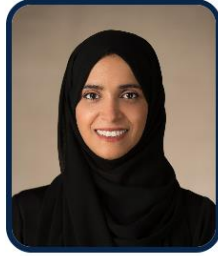
سعادة مريم عيد المهيري