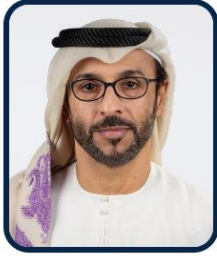
سعادة عبدالله عقيدة المهيري